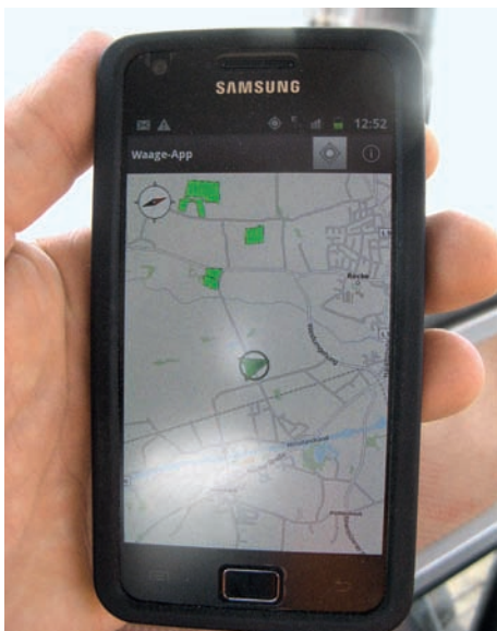
Fa. Claas stellte zwei Smartphones mit verschiedenen Anwendungen zur Verfügung, hier die Waage-App.

Während des Tests wurde aufgrund der Positionsungenauigkeit des Smartphone-GPS einmal bei der Vorbeifahrt ein bereits abgeernteter Schlag identifiziert. Die Anwendung war jedoch in der Lage, die Fehlerinterpretation selbstständig zu korrigieren. Bei der Zuordnung konnten Herkunft und Wiegeergebnis in einem einzigen Fall nicht in Einklang gebracht werden, da diese Wiegung manuell durchgeführt wurde.