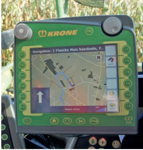
FieldNav (Fa. Lacos) ermöglicht die komfortable Navigation zum Schlag.

lassen des Schleges wird dessen Identität an eine Datenbank geschickt. Wenn das Fahrzeug an der Waage ankommt, wird auch dies automatisch erkannt, weil die Position – wie bei den Feldern – ebenfalls im System hinterlegt ist. Der Zeitpunkt des Eintreffens an der Waage wird registriert und ebenfalls an die Datenbank gesendet. Wenn der Wiegevorgang erfolgreich ausgeführt wurde, sendet die Waage das Ergebnis unverzüglich an die Datenbank. Eine Anwendung auf dem Server ermöglicht es nun, die Herkunft und Menge des Erntegutes in Beziehung zu setzen. Ein wiederum automatisch aus den Serverdaten erstelltes Tagesprotokoll listet die Transport- und Wiegevorgänge in tabellarischer und kartografischer Form auf. Mit dieser Lösung ist sicher gestellt, dass alle Lieferungen für Abrechnung und Qualitätssicherung komplett dokumentiert werden. Nebenbei unterstützt das Programm den Fahrer bei Bedarf auch beim Auffinden des nächsten zu erntenden Schleges.